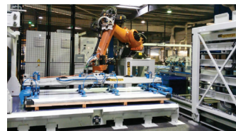
Cellule automatisée de palettisation.

Afin de profiter pleinement de cet atout concurrentiel, le groupe dis- pose d'une structure chargée d'articuler ses différentes exper- tises pour proposer des lignes process cohérentes, répondant pleinement aux attentes des industriels en matière d'automati- on. Cette filiale, appelée AR Tech- man, dispose d'un atelier de 4 000 m 2 et emploie 30 collab- orateurs. Ceux-ci sont non seule- ment capables de concevoir des chaînes complètes, avec tous leurs étages successifs, mais ils sont en outre en mesure d'y intégrer différentes